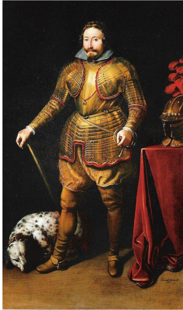
Fig. 1. Juan van der Hamen y León, Jean de Croÿ, II conde de Solre , 1626. Colección particular.

y a partir de entonces desempeñó importantes misiones diplomáticas en Francia, Polonia, Alemania y los Países Bajos 6 .