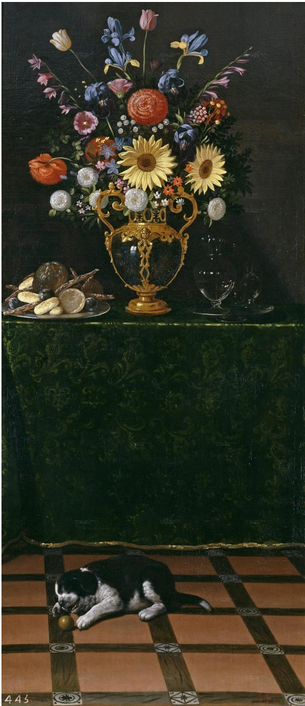
Fig. 2. Juan van der Hamen y León, Bodegón con florero y cachorro , ca. 1625. Madrid, Museo Nacional del Prado (n.º inv. P004158).

Retiro, y algunas de las cuales, como los Bodegones con perro de Van der Hamen (Figs. 2 y 3), fueron llevadas al Real Alcázar de Madrid, en donde figuraban en el inventario de 1666, en la habitación en la que el rey cenaba 20 . Asimismo, Peter Cherry propuso, muy acertadamente, que todas ellas se destinaron seguramente a la decoración del Alcázar, pero no tenía muy claro si fueron compradas por Felipe IV, o le fueron regaladas 21 .