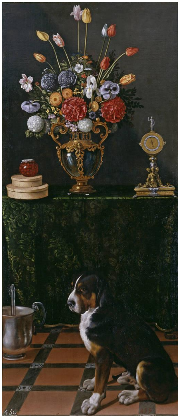
Fig. 3. Juan van der Hamen y León, Bodegón con florero y perro , ca. 1625. Madrid, Museo Nacional del Prado (n.º inv. P006413).

Entre las 28 obras elegidas por el rey de la almoneda de Solre, de las que solo 19 estaban enmarcadas con molduras negras