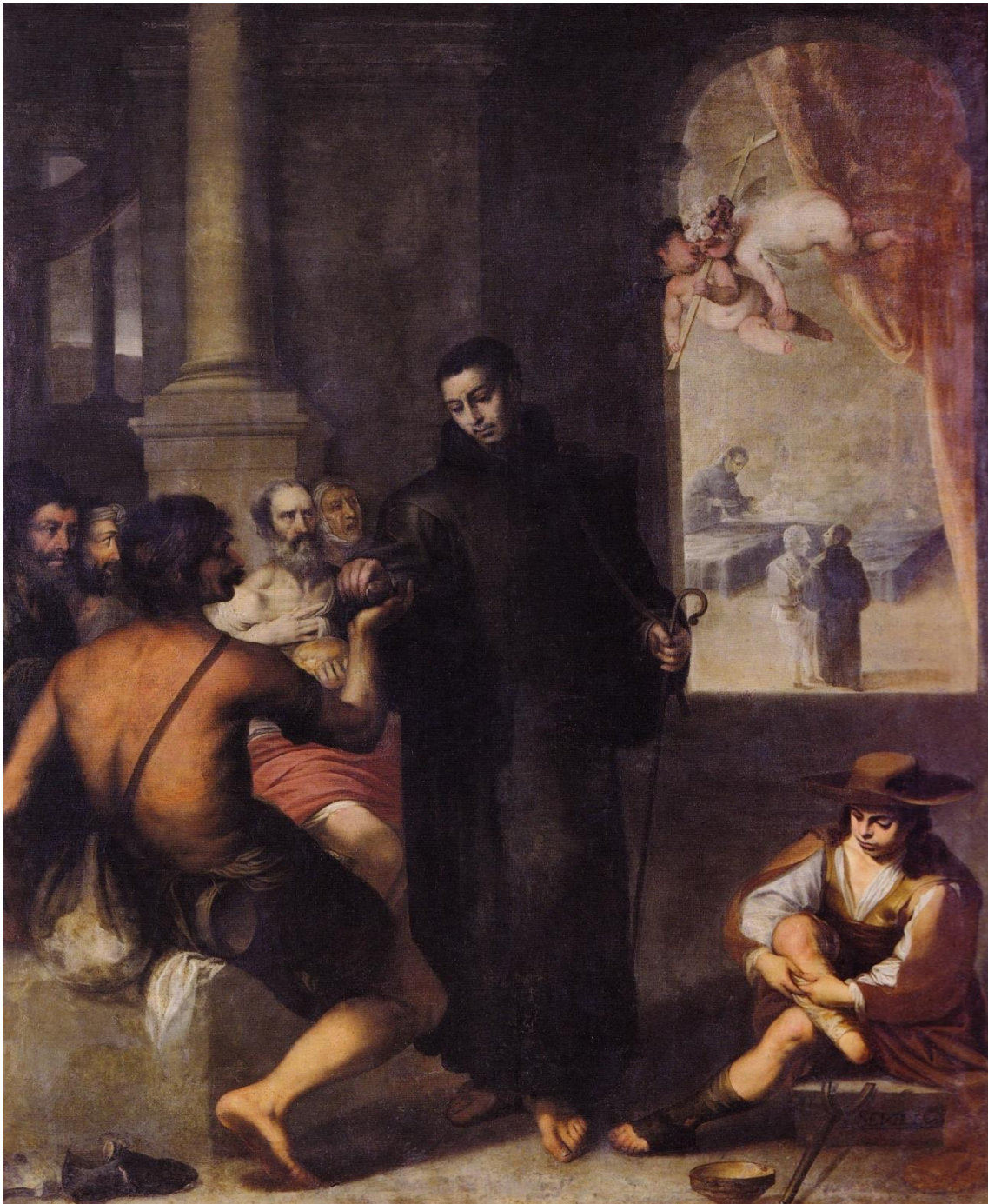
Foto 5. Juan de Sevilla, San Juan de Dios repartiendo limosna , 1670, firmado: "Sevilla". Granada, hospital de la Caridad y Refugio.

XVIII, cuando manifestó que este cuadro "es tan llegado en un todo al estilo del referido Murillo que muchos pintores piensan ser suyo" 39 . No obstante, está por ver si el pintor granadino llegó a conocer directamente esta pintura,