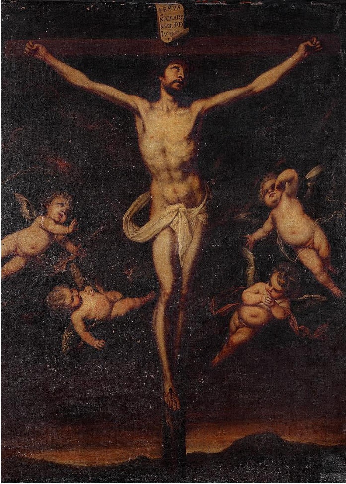
Fig. 7. Pedro Atanasio Bocanegra, Cristo crucificado con cuatro ángeles , ca. 1670. Colección particular.

nación de la Virgen (102 x 82 cm) 58 . De ser esta la pintura que perteneció al Refugio, estaríamos ante un importante precedente para el gran lienzo que Bocanegra firmaría dos años más tarde con destino a la catedral de Granada. Tanto la composición del Cristo como la disposición del paño de pureza y el tipo de cruz resultan extraordinariamente cercanos, aunque el cuadro catedralicio se enriqueció con un mayor número de ángeles y alguna cita rubeniana 59 . Del mismo modo, la obra puede ponerse en relación con una pintura de gran formato conservada en el Museo de Bellas Artes de Granada (CE/0192/04), en la que la imagen de Cristo expirante vuelve a aparecer rodeada por cuatro ángeles niños.