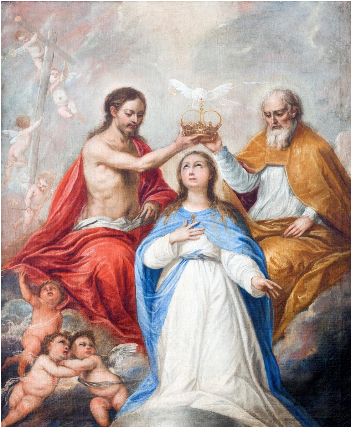
Fig. 6. Pedro Atanasio Bocanegra, Coronación de la Virgen , 1671, firmado al dorso: “Pº Athanasio 1671”. Granada, hospital de la Caridad y Refugio.

en el tiempo, incluso después de que el primitivo retablo pictórico fuera sustituido hacia 1730 por otro retablo de estípites que hoy se conserva en la capilla del nuevo hospital 51 . Sería entonces cuando la hermandad vendió el