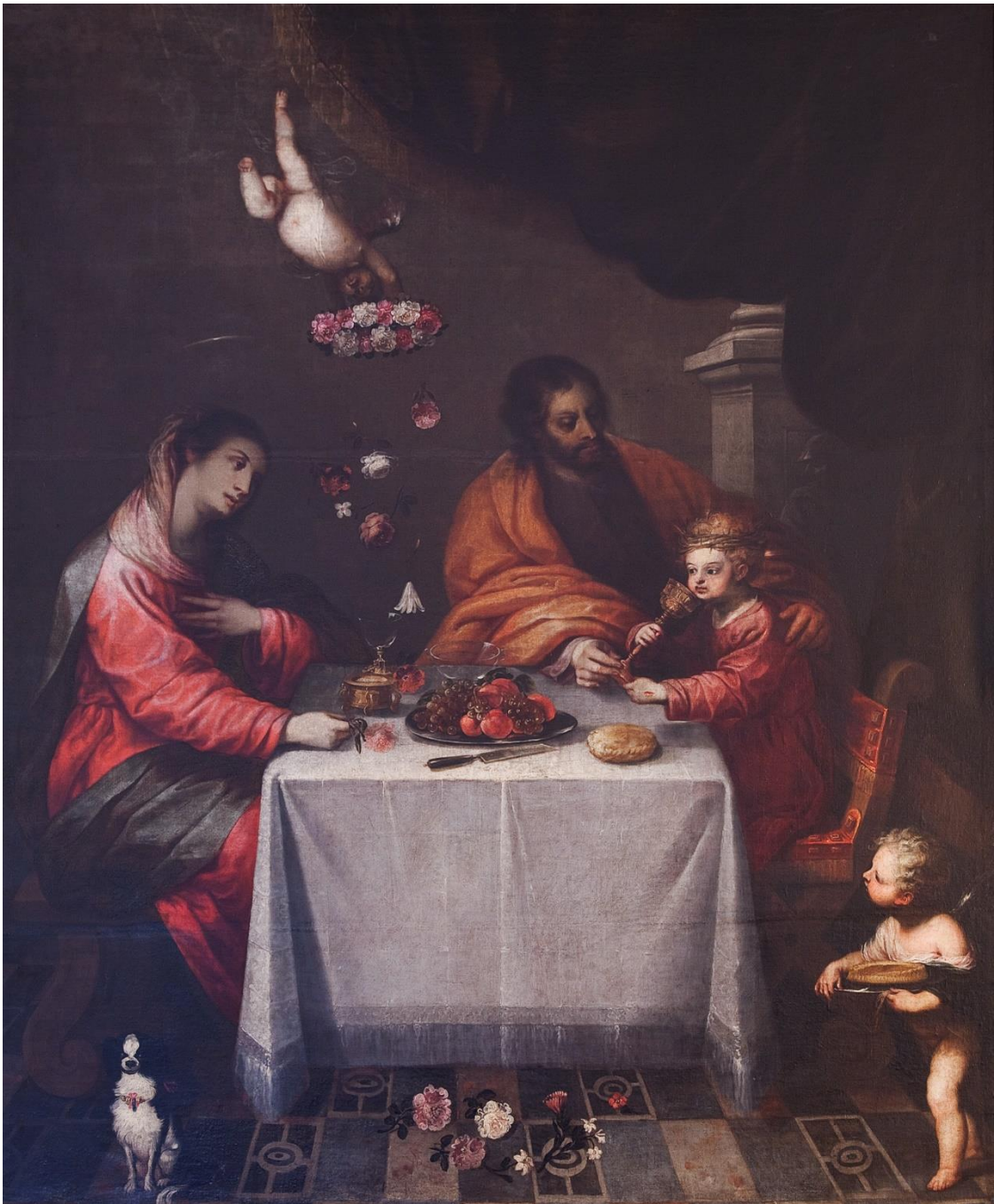
Fig. 4. Juan de Sevilla, Cena de la Sagrada Familia , 1669. Granada, hospital de la Caridad y Refugio.

El Hogar de Nazaret o La comida de Jesús Niño y El anuncio de la Pasión 35 (Fig. 4). En realidad, la iluminación de la escena invita a pensar que se trata de la representación de otra cena, esta vez protagonizada por la Sagrada Familia, como clara prefiguración de la Última Cena y de la propia Cena de