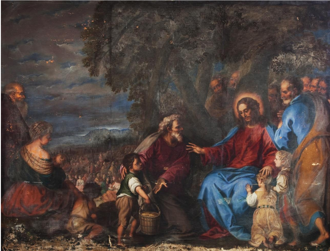
Fig. 14. Pedro Atanasio Bocanegra, Multiplicación de los panes y los peces , 1672. Granada, hospital de la Caridad y Refugio.

Bocanegra ya se encontraba trabajando en este lienzo en septiembre de 1672 y lo ultimó antes del 11 de diciembre, cuando se despacharon al rector del hospital 1.500 reales de vellón para que terminara de pagar "el lienço, pinttura, marco y dorado del quadro de Pan y peçes que pintto Pedro Attanasio" 85 . El Libro de juntas y limosnas aclara que el coste total ascendió a 200 ducados (2.200 reales), que se gastaron del siguiente modo: 1.400 reales en la pintura, 500 en el marco y los 300 restantes en "regalos y ultramar, portes y clavos y el lienzo imprimado que se le dio [a Bocanegra] para pintarlo". El ultramar costó exactamente 8 ducados, que se obtuvieron de la sisa de la carne de tres meses 86 .