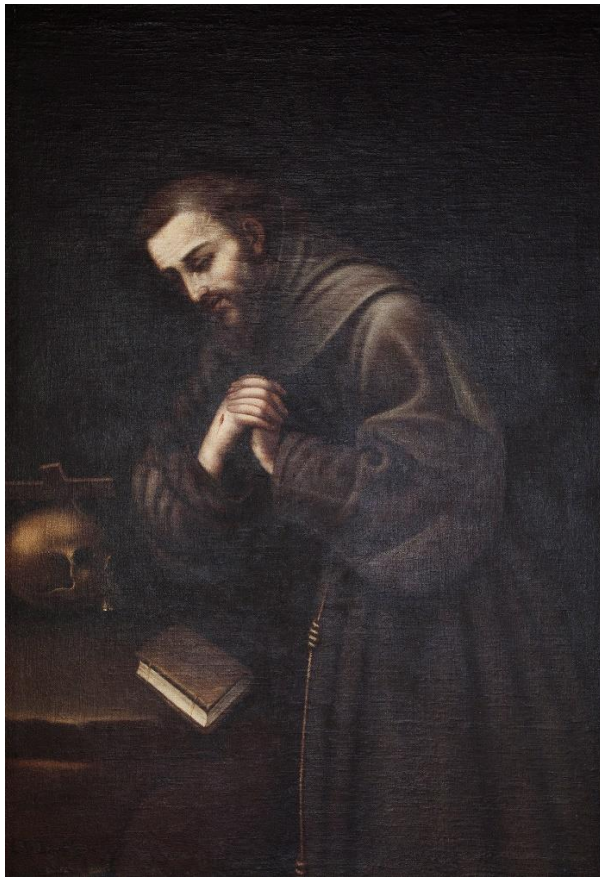
Fig. 13. Mariana de la Cueva, San Francisco de Asís en meditación , 1672. Firmado: "Cueva". Granada, hospital de la Caridad y Refugio.