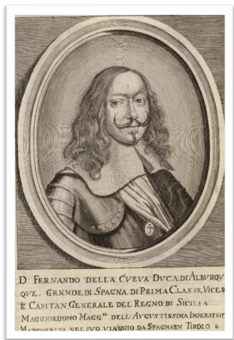
Fig. 8. Anónimo (siguiendo a Wautier ?), Retrato de Don Francisco Fernández de la Cueva, VIII duque de Albuquerque . Grabado 1674. Madrid, Biblioteca Nacional