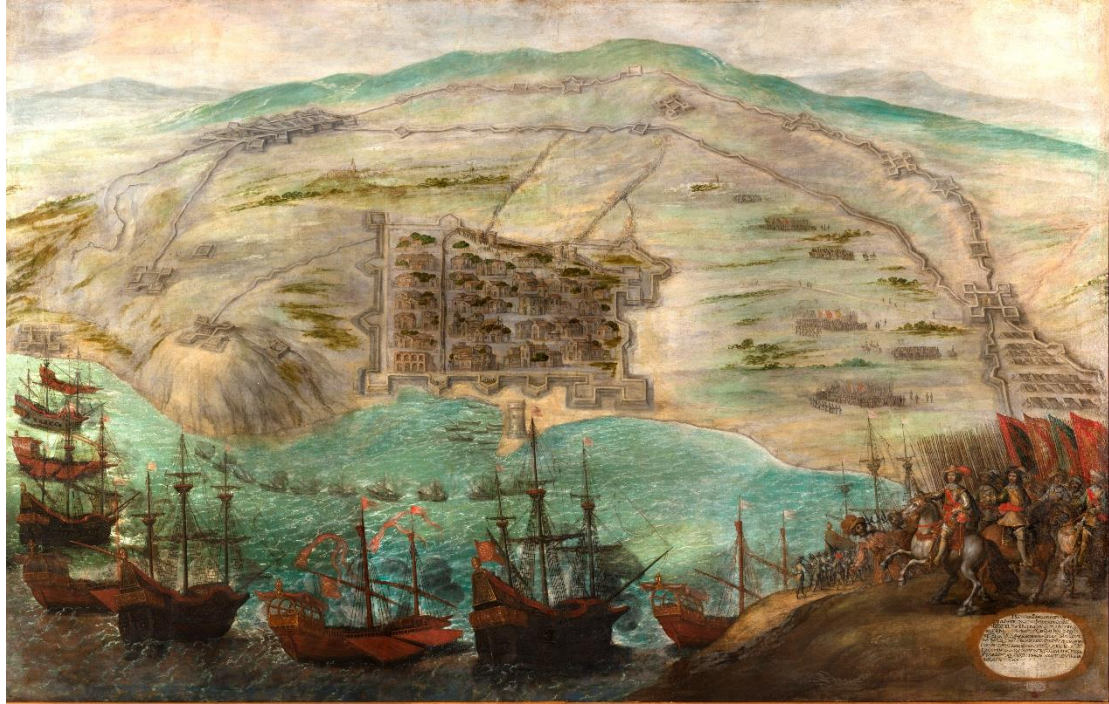
Fig. 14a. Anónimo español del siglo XVII. El Sitio de Barcelona, 1651-1652 . Lienzo, 202,5 x 319 cm. Barcelona, Museo de Historia de Cataluña, (inv. inv. MHC4605).

las Artes Liberales siguiendo cartones de Cornelis Schut 86 ? ¿Y Alburquerque? También él, como veremos, amaba las Bellas Artes.