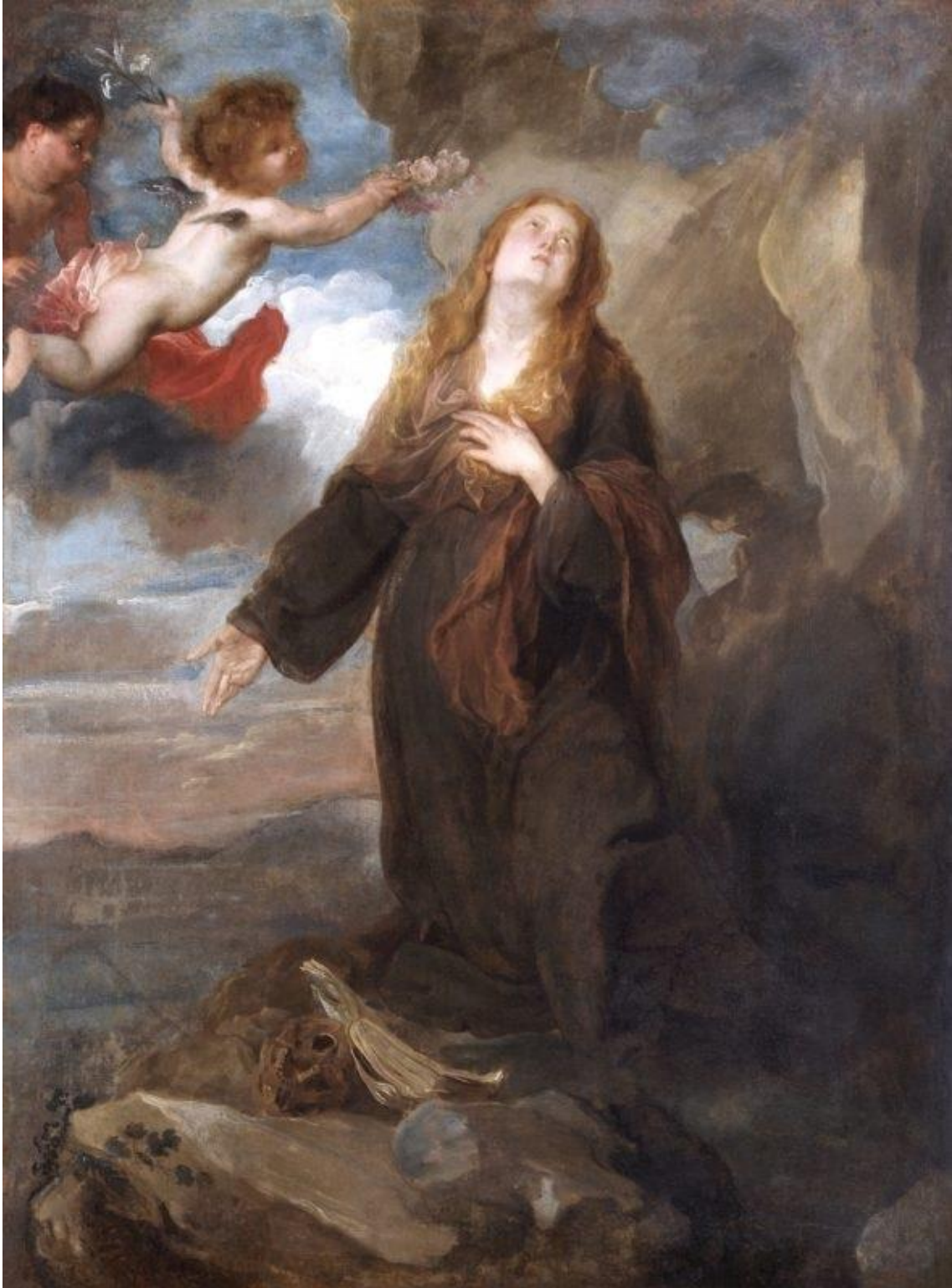
Fig. 15. Anton van Dyck. Santa Rosalía , lienzo, 114 x 84 cm. Londres, Apsley House, colección del duque de Wellington© (inv. 246)