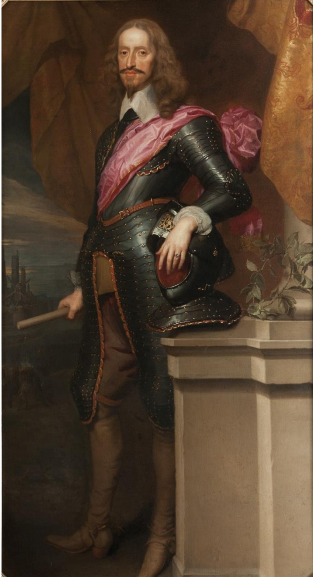
Fig. 6. Charles Wautier. Retrato del archiduque Leopoldo Guillermo de Austria vencedor de la Batalla de Dunquerque en 1652 . Supuestamente firmado: "C. Wautier", lienzo, 210 x 120 cm. República Checa, Chateau Hluboká, (inv. HL-HL-05510)

Nos preguntamos si el grabado de Albuquerque -sin inscripción que testimonie de su autoría- no derivaría también de un retrato de los Wautier como éste, como parecen indicar las fuertes analogías. Sucede a menudo que, a medida que se publican los grabados en ediciones más tardías, se omiten las inscripciones que recuerdan los nombres del pintor y/o del grabador. Es lo que se ha observado, por ejemplo, al comparar los cinco grabados conocidos con el Retrato de Andrea Cantelmo : la inscripción "Michaelina Woutiers pinxit" presente abajo a la izquierda en la primera edición de 1643 (Fig. 10), cambia de ubicación y de tamaño en ediciones posteriores para terminar por desaparecer por completo 22 . En el caso del Retrato de Antonio Pimentel de Prado nos preguntamos si hay que dar crédito a la inscripción "C. Woutiers pinx" del grabado y concluir que Charles Wautier realmente ejecutó un segundo retrato al óleo, o si el grabado parte del único