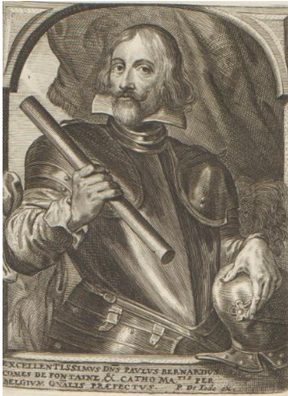
Fig. 12. Pieter de Jode II siguiendo a anónimo. Retrato de Paul-Bernard, conde de Fontaine . Grabado. Anterior a 1651. Amberes, Museo Plantin Moretus, (inv. PK.OPB.0134.102)

dican que Alburquerque estaba al mando de una compañía que había costado él mismo 35 , pero también que había sido decisivo el apoyo del conde-duque de Olivares, quien insistía desde 1640 en que “el duque de Alburquerque ha dado muestras de valor personal, y es mozo, y parece de buen aliento”; alegando que su valor se vio en el sitio de Fuenterrabía, por lo que se le podría “enviar á Flandes, y que sirva con dos compañías de caballos, y después mudarle a la infantería” 36 .