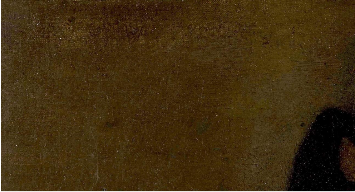
Fig. 2. Detalle de la firma rascada (arriba a la izquierda), Retrato de don Francisco Fernández de la Cueva, VIII duque de Alburquerque .

sado 8 , cuando el nombre de Wautier no resultaba conocido. Al margen de esto, el estilo de los Wautier se reconoce con facilidad, aunque cabe siempre la duda de si sería obra de Charles o de su hermana Michaelina. Por las características del retrato y su cotejo con obras firmadas por ella, cabría pensar que fuera de su mano. La ubicación de la firma, arriba a la izquierda, y la larga extensión de la zona rascada apuntan también a esta hipótesis, pues Michaelina -a juzgar por las firmas conocidas- suele firmar en minúsculas y con el nombre completo, a diferencia de su hermano, que suele firmar con la inicial "C", seguida del apellido "WAUTIER", en mayúsculas. No obstante, existe también la sospecha de que algunas obras firmadas por Charles pudieran ser de la mano de su hermana 9 . Ante estas circunstancias, y dada la similitud de sus estilos, pensamos que, en vez de tratar de deslindar al uno del otro, cabría más bien hablar de los Wautier.