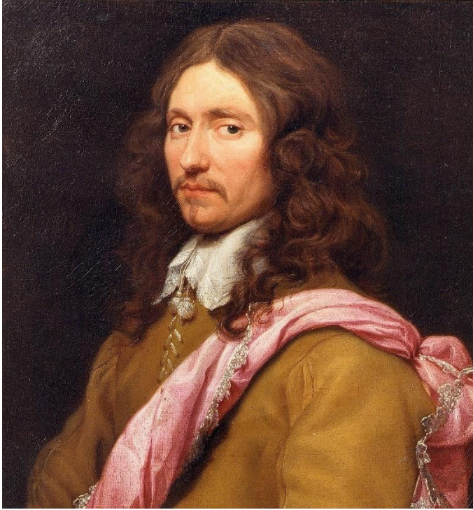
Fig. 3. Michaelina Wautier, Retrato de Don Antonio Pimentel de Prado , firmado y fechado (arriba a la derecha): "Michaelina Wautier 1646". Lienzo, 63 x 56,5 cm. Bruselas, Musées Royaux des Beaux Arts (inv. 297).

Bruselas identificado en 2018 con Don Antonio Pimentel de Prado 10 (Fig. 3), pintura firmada y fechada: "Michaelina Wautier. 1646" 11 , lo que demuestra – junto con el Retrato de Andrea Cantelmo grabado en 1643 12 (Fig. 10)- que desde fechas tempranas Michaelina está en contacto con la élite militar. Son claras las analogías en términos formales, de encuadre, colorido y estilo. El lienzo que nos ocupa tiene la misma anchura y unos cinco centímetros más de alto. Ambas figuras se insertan de idéntica manera en el mismo espacio circundante, sobre un fondo pardo oscuro, como en todos sus retratos conocidos. Especialmente comparable es el tratamiento de los cabellos, la construcción del rostro y el diseño de los ojos, con una acuosidad muy característica que confiere una emotiva profundidad a la mirada, evitando la dirección frontal, como es el caso también en el Retato de Martino Martini