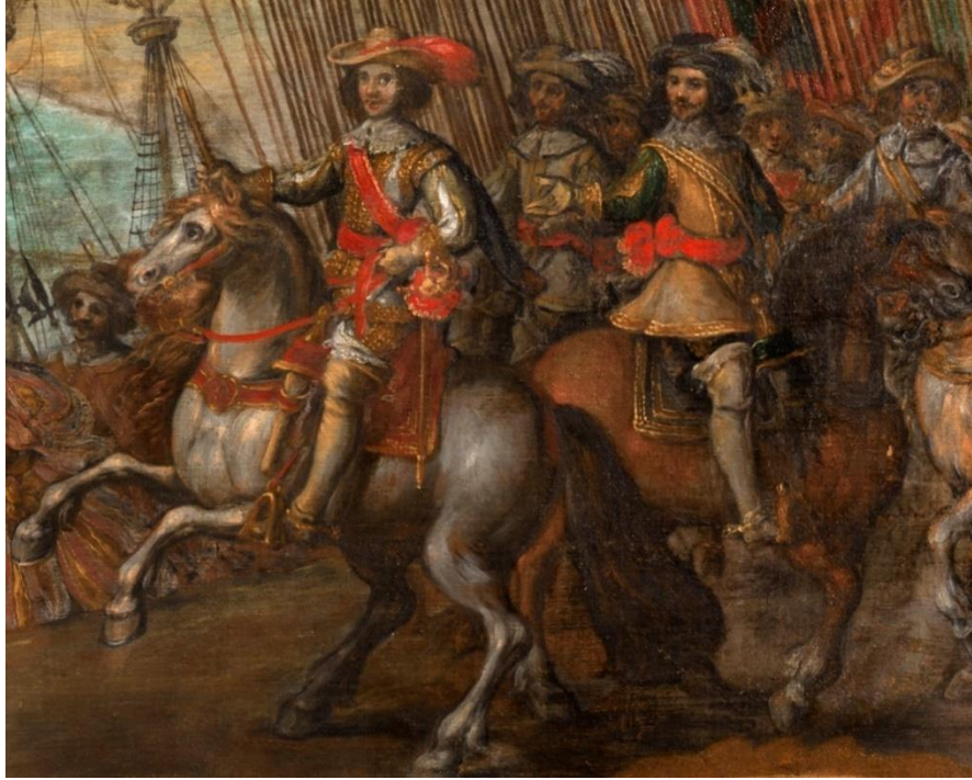
Fig. 14b. Anónimo español del siglo XVII. El Sitio de Barcelona, 1651-1652 . Detalle

rido últimamente dos grandes lienzos que recuerdan su actuación en estas campañas: el Sitio de Tortosa en 1648 y el Sitio de Barcelona en 1651-1652 91 , (Figs. 14a y 14b) donde se reconoce a Alburquerque junto a Don Juan José de Austria 92 , montado en su caballo y tocado con su sombrero negro. De idénticas medidas y probablemente ejecutados por la misma mano, estos lienzos debieron ser encargo de Alburquerque, protagonista en las dos batallas muy destacado en las inscripciones, con intención de subrayar sus