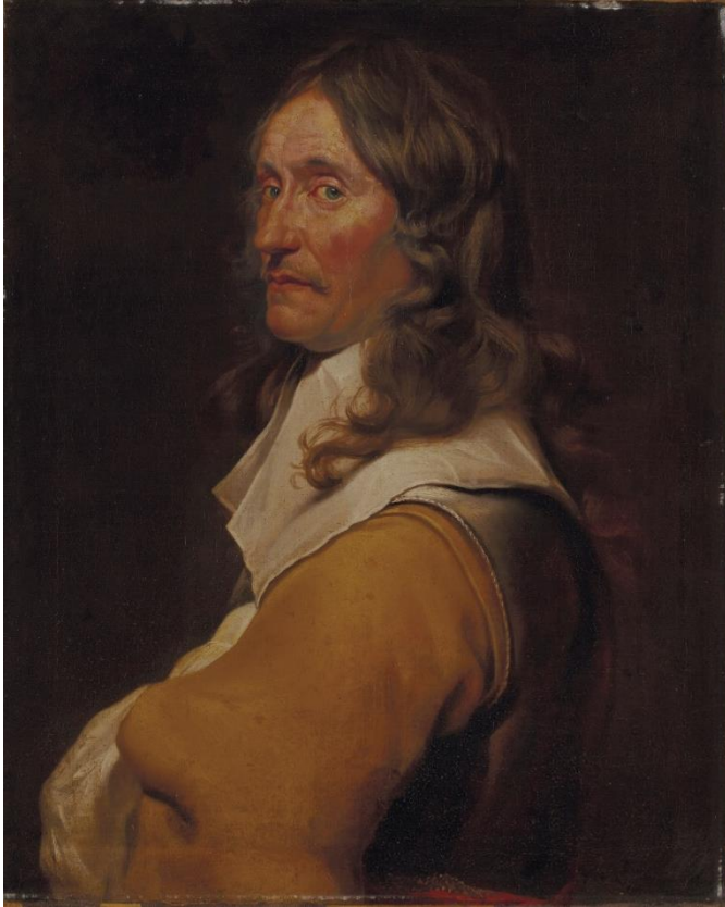
Fig. 5. Michaelina Wautier. Retrato de Pierre Wautier , ca 1662, lienzo, 73 x 58,5 cm. Colección privada.

En cuanto a la identidad del retratado, su indumentaria no deja lugar a dudas de que se trata de un alto militar al servicio del rey de España. Dados sus rasgos, muy marcados, teníamos esperanzas de hallar su nombre. Una intensa búsqueda entre posibles candidatos nos permitió dar con un personaje de idénticas características: cejijunto, con los mismos ojos grandes, el cabello largo en bucles, los labios protuberantes, el particular bigote y la perilla. Se trata de Don Francisco Fernández de la Cueva, VIII duque de Alburquerque, Grande de España, virrey de México y de Sicilia, caballero de la Orden de Santiago (Barcelona, 1619 - Madrid, 1676). Lo reconocimos en un grabado reproducido y publicado por el historiador Galeazzo Gualdo Priorato en 1674 16 (Fig. 8). La cartela que acompaña la imagen de nuestro ilustre personaje en aquella edición yerra en el nombre de pila del retratado, llamándolo Fernando –según su patronímico– en lugar de