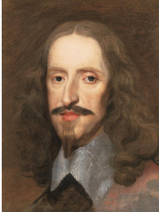
Fig. 7. Charles Wautier. Retrato del archiduque Leopoldo Guillermo de Austria , 1652, lienzo, 43 x 34,2 cm. Paradero desconocido

retrato conocido, firmado por Michaelina, introduciendo cambios de indumentaria y accesorios. Estos interrogantes quedarían resueltos si apareciera un retrato repitiendo el modelo del grabado, pero las evidencias hasta ahora disponibles son prueba de cómo la producción de estos hermanos está profundamente imbricada.