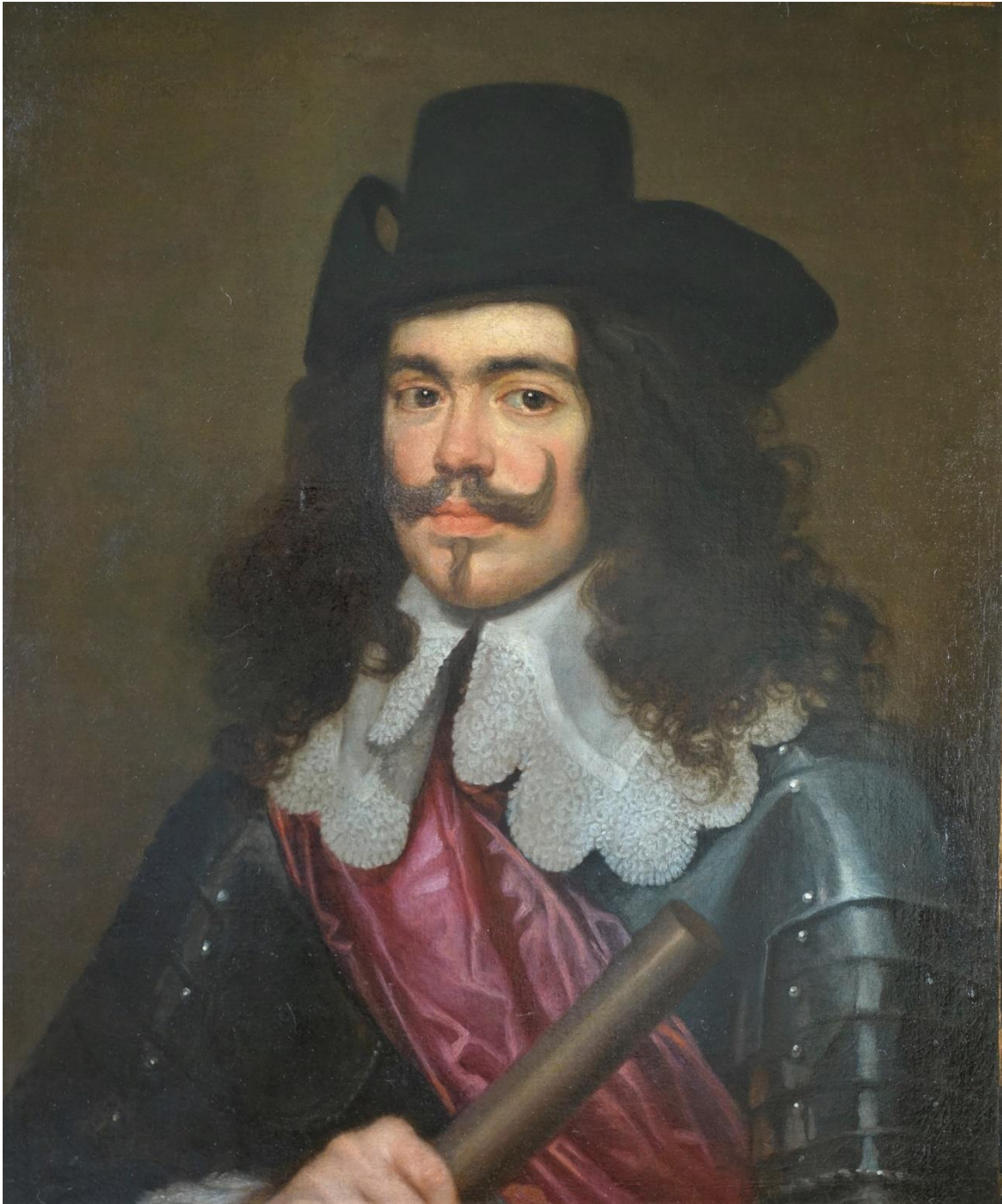
Fig. 1. Michaelina y Charles Wautier (posiblemente Michaelina), (aquí atribuido). Identificado aquí como Retrato de don Francisco Fernández de la Cueva, VIII duque de Alburquerque , ca 1640-1643, lienzo, 68,5 x 56,2 cm. Reino Unido, colección privada.