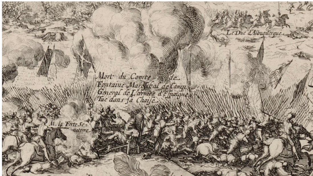
Fig. 11b. A Boudan. Rocroi, o Les Heureux commencements du règne de Louis XIII , detalle.

retrato grabado de Fontana, con armadura, casco y bastón de mando, fue incluido en el Theatrum pontificium imperatorum, regum, ducum, principum editado por Peter de Jode en Amberes en 1651 32 (Fig. 12).