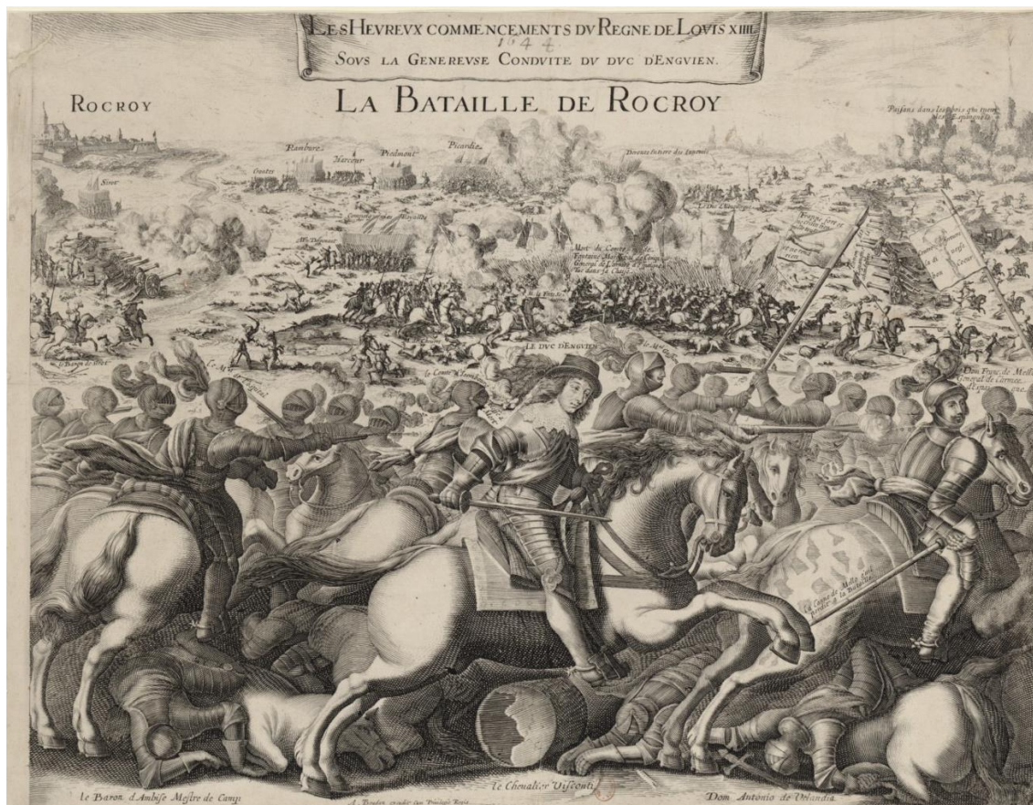
Fig. 11a. A Boudan. Rocroi, o Les Heureux commencements du règne de Louis XIII sous la généreuse conduite du duc d'Enguien . Paris, Bibliothèque Nationale de France, département Estampes et photographie, (RESERVE QB-201 (37)-FOL)

mando de la infantería de Flandes que, inválido, dirigiendo sus ejércitos desde una silla, murió en la batalla; detalle que no omiten los grabados franceses, incluyendo la leyenda "Muerte de Fontana Mariscal de Campo General del Ejército de España. Matado en su silla" 31 (Figs. 11a y 11b). Alburquerque está representado poco más arriba, retirándose con el resto de la caballería. Un