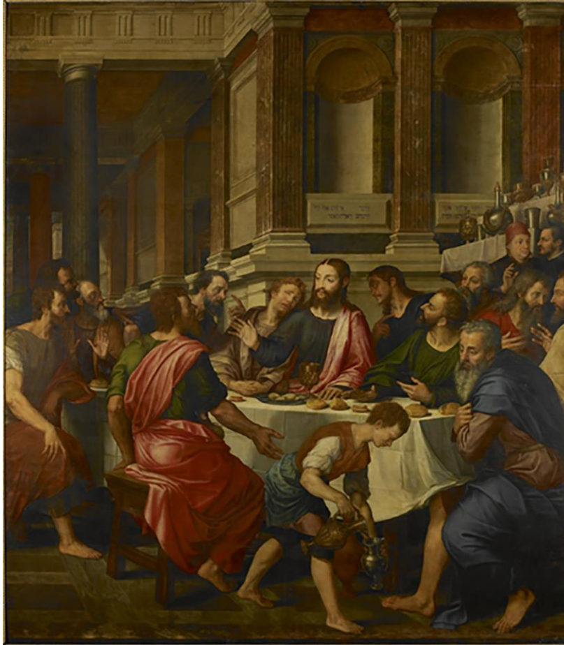
Fig. 4. Michiel Coxcié, Última Cena , 1567. Bruselas, Museo de Bellas Artes (nº inv. 42)

mente que "la más evidente, y quizás la más inédita de las influencias que se aprecian en el estilo de Miguel [Coxcié] sea la lombarda. Es sorprendente como, de una manera irregular y discontinúa, el pintor acude a Leonardo y a sus discípulos cuando pretende dar expresión delicada" 16 . El desconcierto del especialista ante su propia intuición de connoisseur se basaba en el desconocimiento que por entonces se tenía de un posible viaje de Coxcié a Milán, el cual se confirmó posteriormente, documentándose al pintor diseñando una serie de tapices para la catedral de la capital lombarda desde junio hasta agosto de 1539 17 .