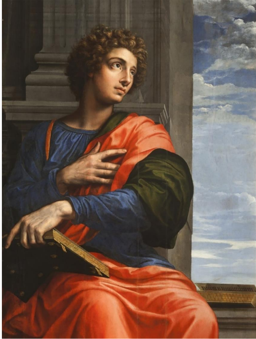
Fig. 6. Michiel Coxcie, Detalle de San Juan Evangelista (ala del tríptico de San Lucas dibujando a la Virgen de Jan Gossaert). Praga, Catedral de San Vito, San Wenceslao y San Adalberto