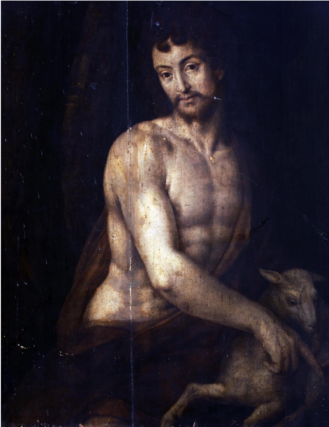
Fig. 1. Michiel Coxcie, San Juan Bautista , c. 1520-1530. Granada, Sagrario de la Catedral.