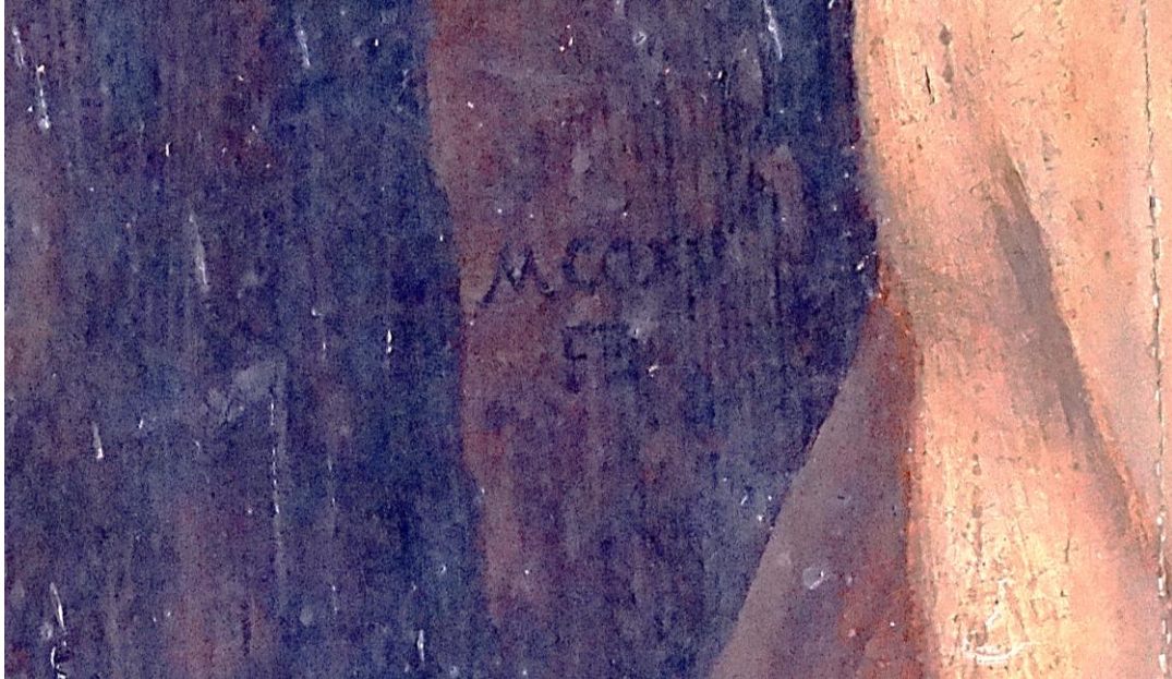
Fig. 2. Michiel Coxcie, Detalle de la firma en el San Juan Bautista, c. 1530-1560. Granada, Sagrario de la Catedral.