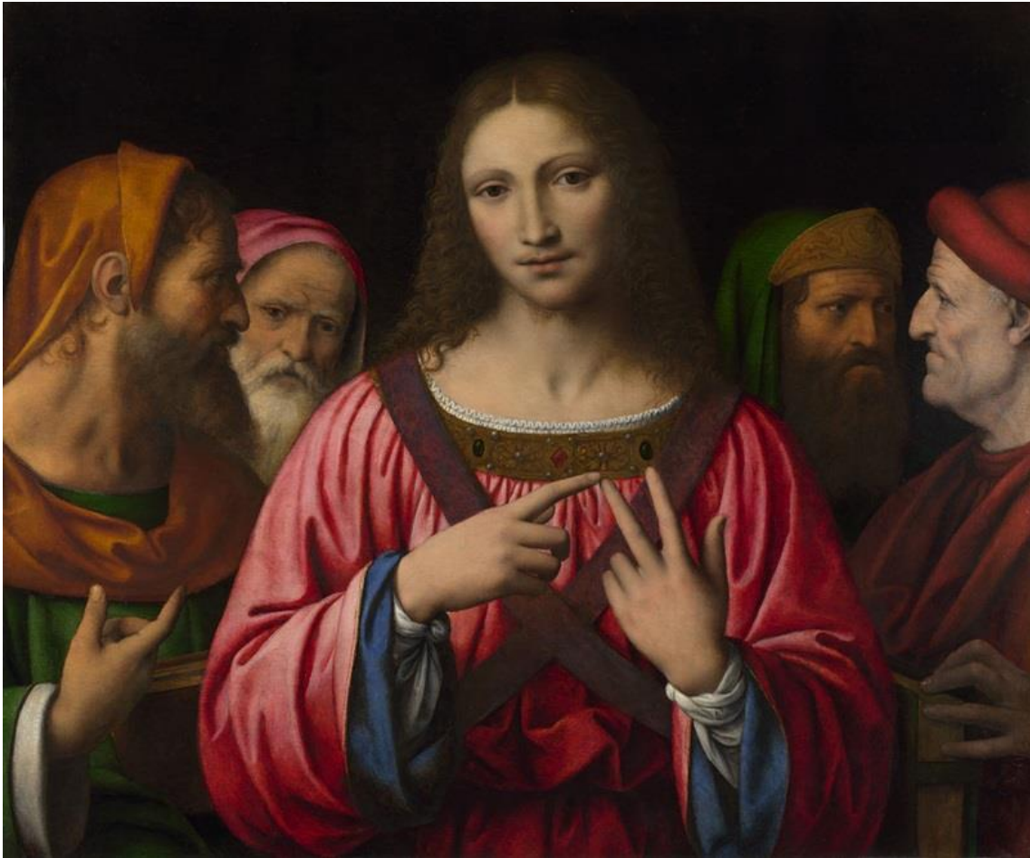
Fig. 3. Bernardino Luini, Cristo entre los doctores , 1480-1532. Londres, National Gallery, (n° inv. NG18)