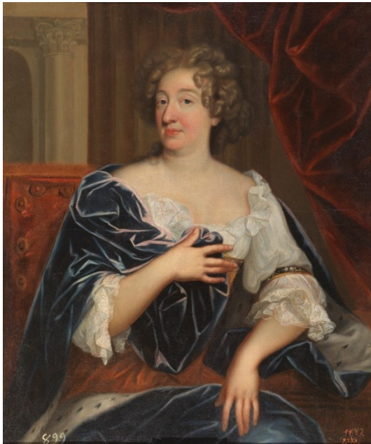
Fig. 8a. Anónimo, Ana María Luisa de Orleans, duquesa de Montpensier , Museo del Prado