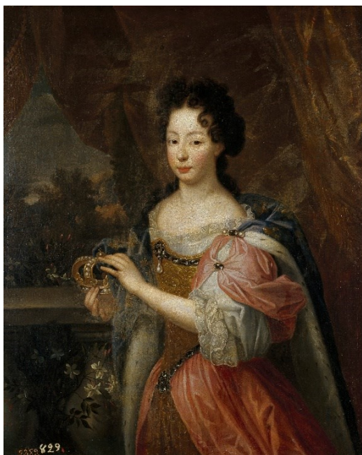
Fig. 4a. Ana María de Orleans (identificación aquí propuesta), Museo del Prado.