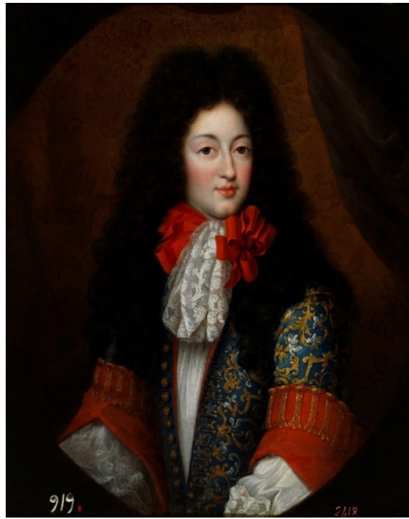
Fig. 9. María Luisa de Orleans en traje de caza (identificación aquí propuesta). Museo del Prado

mo tamaño que el anttezte de una sra Reyna y del propio autor en doscientos Reales de vellón” 67 .