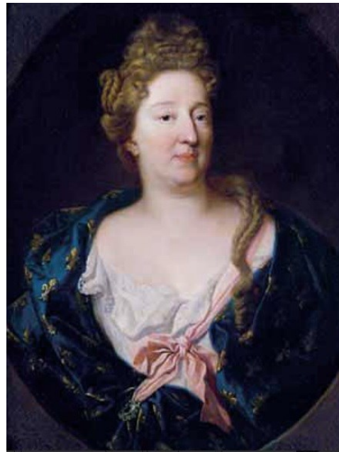
Fig. 8b. Hyacinthe Rigaud, Ana María Luisa de Orleans, duquesa de Montpensier , Kunsthistorischesmuseum, Viena

Las medidas de esta pintura concuerdan con las de los demás retratos y seguramente se corresponde con alguno de los abundantes registros de los inventarios de 1734 y 1747, que consignan retratos de personajes armados sin ofrecer más detalles. En concreto, podría corresponder con el número 293 del inventario de 1747: "Vn Retrato de Cauallero con un Morrión en la mano de vara y quarta de caída y vara de ancho de [f.331] mano no conocida en Doscientos Reales" 65 .