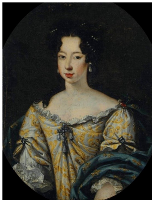
Fig. 4b. Anónimo, Ana María de Orleans , colección particular

tario general de pinturas del museo del Prado 41 , se sostiene su identificación con dudas, pero se trata con certeza de la duquesa. Otra obra de Mignard conservada en una colección privada belga así lo confirma 42 . En este cuadro aparece con el mismo peinado y aspecto físico, acompañada por sus dos hijos. Se trata de una obra firmada y fechada en 1678, esto es, inmediatamente anterior a la llegada de María Luisa a España. Una copia se conserva en la colección de la Reina de Inglaterra (RCIN 404410).