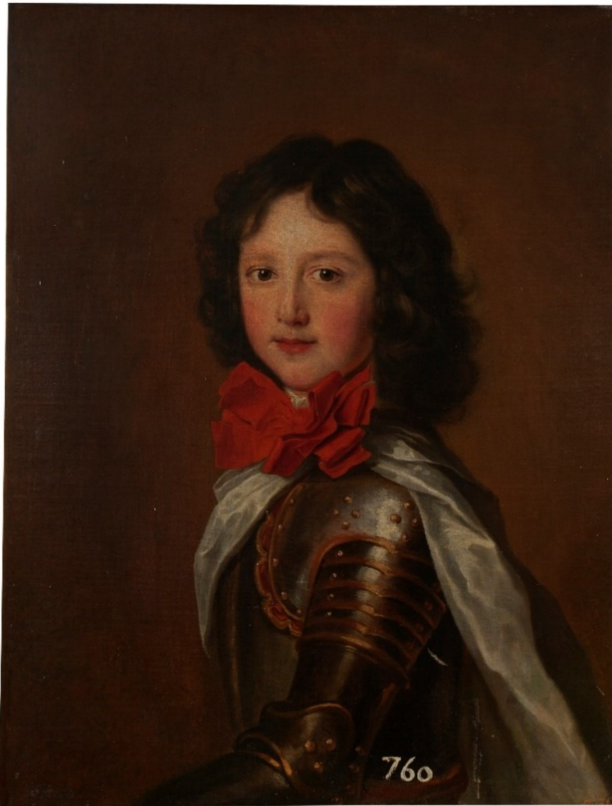
Fig. 12b. Jacob Ferdinand Voet, Felipe de Orleans, duque de Chartres (identificación aquí propuesta), Museo del Prado