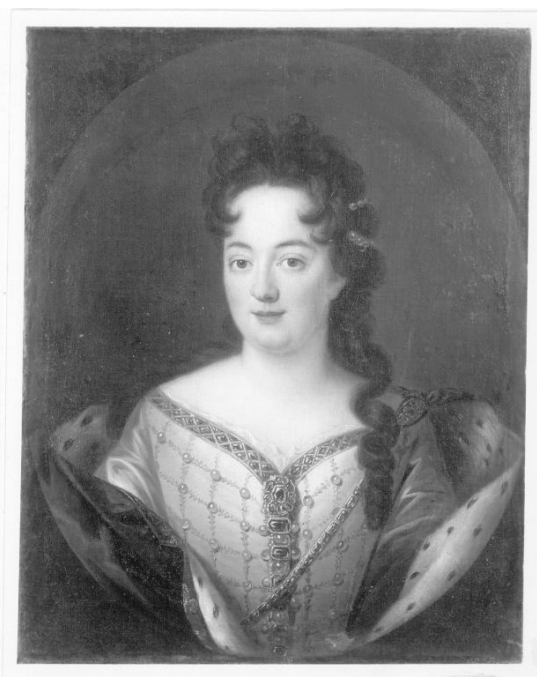
Fig. 11b. François de Troy, atribuido, María Ana Victoria de Baviera, la Gran Delfina , Alte Pinakotek, Munich

El anterior retrato de cazadora ha estado emparejado desde antiguo con un retrato ovalado de una dama francesa sin identificar considerado como anónimo en el museo MNP, cat. P002438 (fig. 11a), pero que pertenece sin duda a la realeza de ese país pues viste un manto azul florliseado. Existe una réplica idéntica en la Alte Pinakotek de Munich (nº 7553), (Fig. 11b) donde figura catalogado como la Delfina María Ana Victoria de Baviera y atribuido al pintor francés François de Troy. El hecho de su presencia en la colección bávara, apunta a favor de una correcta identificación.