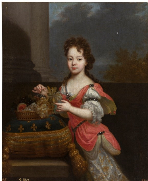
Fig. 7. Nicolás de Largillière. Isabel Carlota de Orleans, futura duquesa de Lorena , Museo del Prado

- Isabel Carlota de Orleans , futura duquesa de Lorena (1676-1744). (MNP, nº cat. P002351) (Fig. 7). Representa a la hija de los duques de Orleans y hermana del anterior, con el que hace pareja y comparte medidas. Se encuentra igualmente recogido en los referidos inventarios de 1734 y 1747. En el primero con el nº 726: "Otro de mismo tamaño sin marco retrato mas de medio cuerpo de vna niña cogiendo ubas de mano no conocida"; y en el segundo bajo el nº 271: "Otro de vna Señorita con un cestillo de Vbas de vara y quarta de Caida y vara de ancho escuela franzesa" 55 . Se trata de una obra de calidad, también de Nicolás de Largillière, actualmente depositada en el museo del Ampurdan. Dominique Brême sugiere que este cuadro fue encargado por la Reina de España y consigna la existencia de dos réplicas, una con variantes en el Museo del Palacio de Versailles (MV 7387) y otra más en colección particular. 56