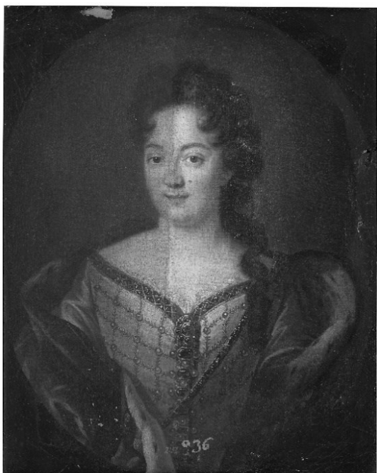
Fig. 11a. Copia de François de Troy?, María Ana Victoria de Baviera , (aquí identificada), Museo del Prado.