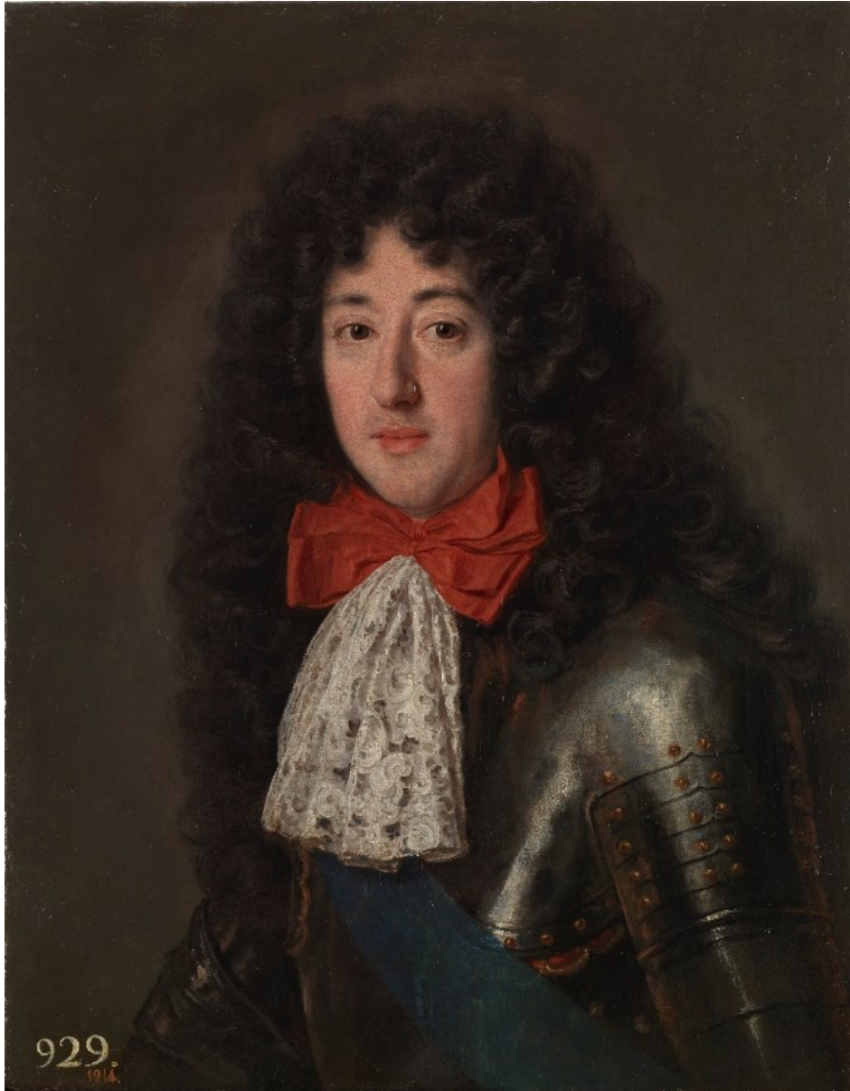
Fig. 12a. Jacob Ferdinand Voet, Felipe, duque de Orleans , Museo del Prado.

de un mancevo armado de medio cuerpo en obalo de mas de ttres quartas de caída y vara y ttercia de ancho en un mil y quinientos rs 81 .