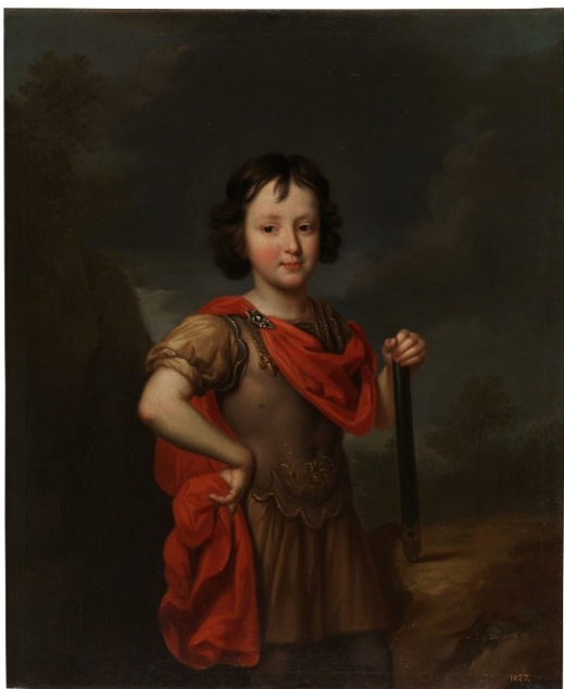
Fig. 6. Nicolás de Largillière, Felipe II de Orleans, duque de Chartres , Museo del Prado