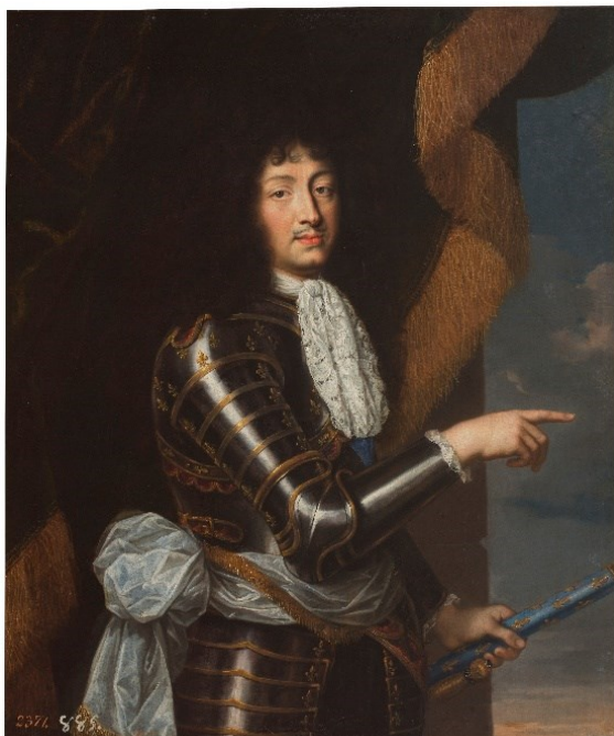
Fig. 2a. Seguidor de Pierre Mignar, Luis XIV , Museo del Prado