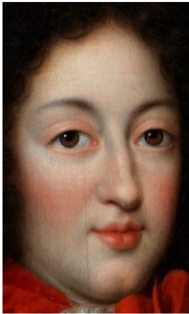
Fig. 9a. Detalle, María Luisa de Orleans en traje de caza , Museo del Prado