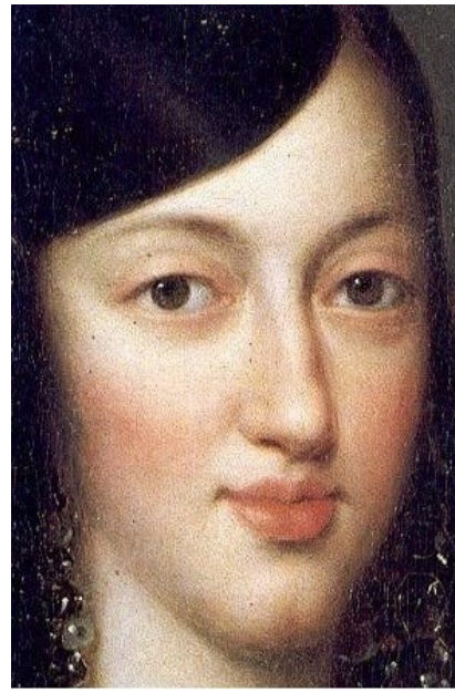
Fig. 9b. Detalle, Retrato de María Luisa de Orleans , colección particular.

fondos del museo de Versailles se conservan otras dos versiones de esta pintura (nº invs. MV 4283 y 3590).