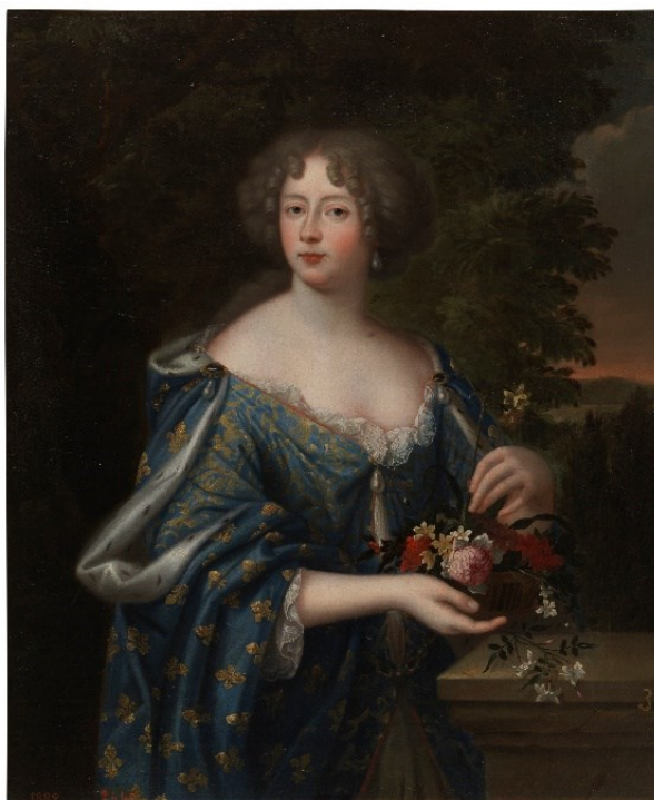
Fig. 3. Copia de Pierre Mignard, Isabel Carlota de Baviera, duquesa de Orleans , Museo del Prado

rados del 722 a 739, de "vara y quarta de largo y vara de ancha, sin marco", que creemos que se pueden identificar con parte de esta serie pues, pese a la parquedad de la información -se limita a consignar que se trata de retratos (caballero armado, Príncipe de la casa real de Francia, señora, princesa, etc...)-, aparecen entre ellos una niña cogiendo uvas, una Diana y un niño armado, que pueden corresponderse con los retratos de Isabel Carlota de Orleans, Víctor Amadeo de Saboya y Felipe II de Orleans, duque de Chartres, más adelante analizados.