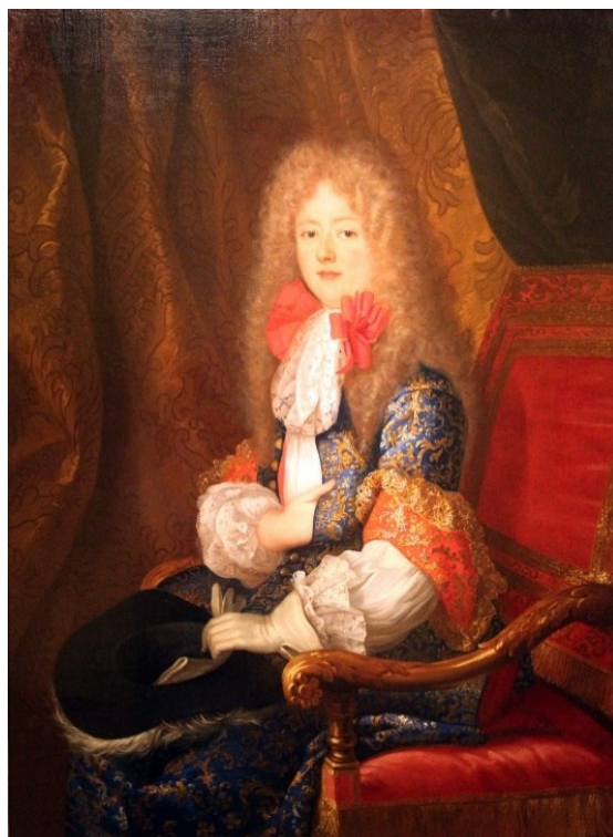
Fig. 10. Louis Ferdinand Elle, atrib., Isabel Carlota de Baviera, duquesa de Orleans, en traje de caza . Berlín, Deutches Historiches Museum

masculina de la época. Al parecer, la hípica era su actividad favorita y fuente de muchos problemas en la corte donde no estaba bien vista esta afición 71 , llegándosele a prohibir su práctica en alguna ocasión.