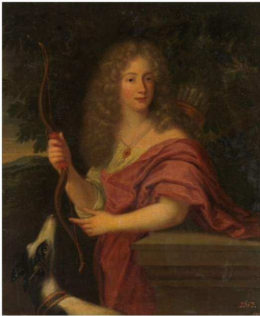
Fig. 5a. Anónimo, Victor Amadeo II de Saboya como Apolo (identificación aquí propuesta), Museo del Prado.