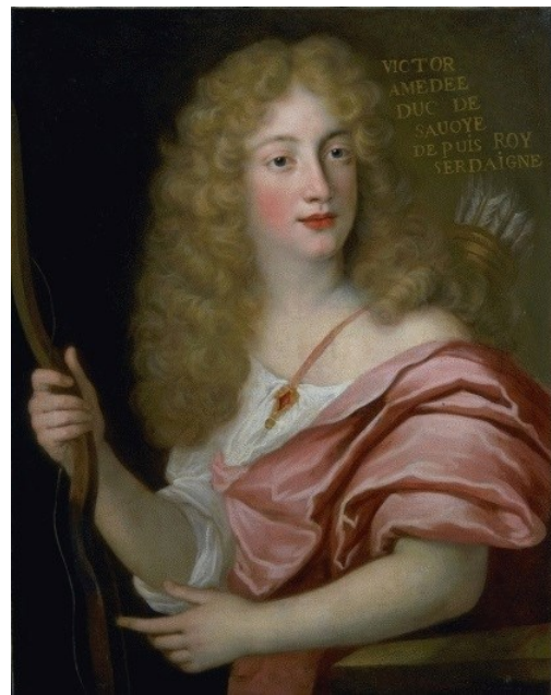
Fig. 5b. Atribuido a Herni Gaspar, Victor Amadeo II de Saboya , colección particular

tariado con el nº 731 del inventario de 1734 y el nº 360 del inventario de 1747. 51